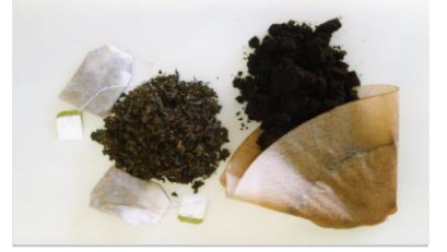
Kahve/Çay telve (Filtreleri)