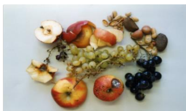
остатки фруктов, скорлупа от орехов