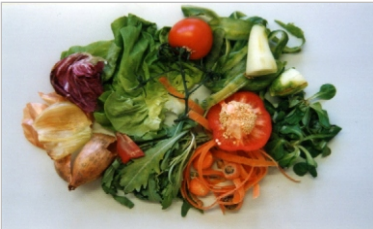
Bio ve Bahçe çöpleri