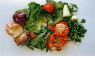
salate - Sebze atıkları