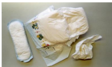
пеленки и подобные предметы гигиены