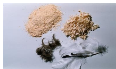
древесные опилки, волос, перья