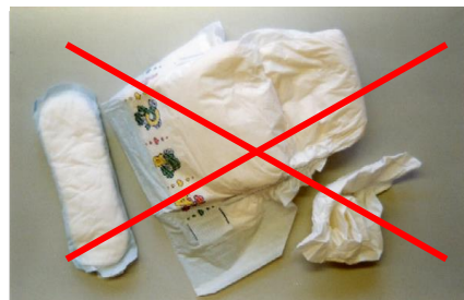
Windeln- und andere Hygieneartikel