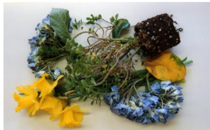
Pflanzen, Blumen, Gartenabfälle