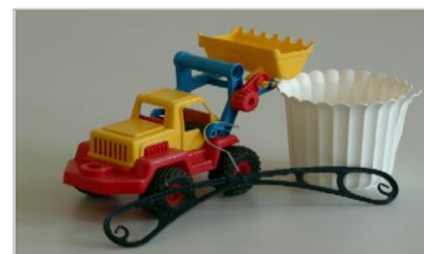
прочий мусор из пластмассы

...а также текстиль, дачная мебель, ящики и горшки для цветов, детские игрушки, электрические приборы.