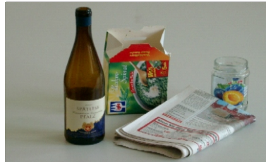
Eski cam, hurda kağıt, Karton