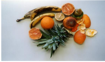
Reste von Südfrüchten