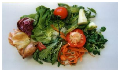
остатки салатов, овощей