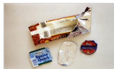
алюминиевая фольга и алюминиевые крышки