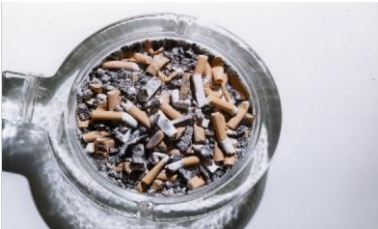
Kül, Sigara izmaritleri