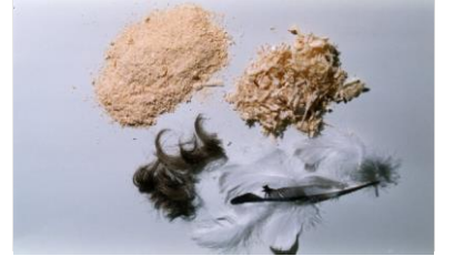
Talaş, Saç, Tüyler