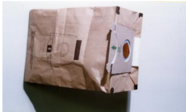
Elektrik süpürgesi torbası