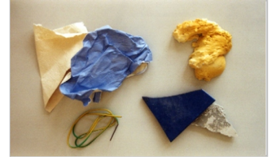
Duvarkağıtları ve inşaat atıkları