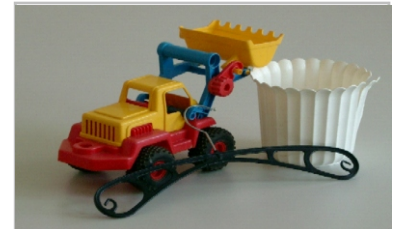
Diğer plastik çöpler

... aynı şekilde Tekstil, Bahçemöbilyası, saksı ve Çiçek kasaları, oyuncak, Elektrikli aletleri.