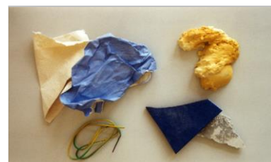
обои, остатки строительных материалов