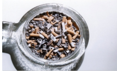
Kül ve Sigara izmaritleri