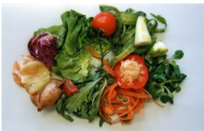
Bio- und Grünabfälle