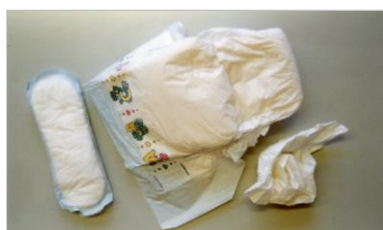
пеленки и подобные предметы гигиены