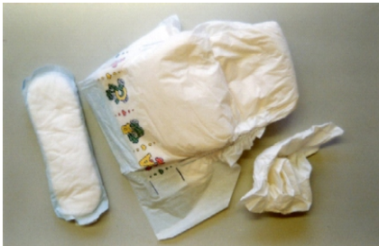
Windeln- und andere Hygieneartikel