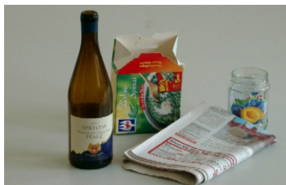
Altglas, Altpapier, Pappe