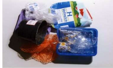
Plastik posetler, içecek kartonları