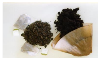
гуща от чая и кофе (с фильтровальной бумагой)