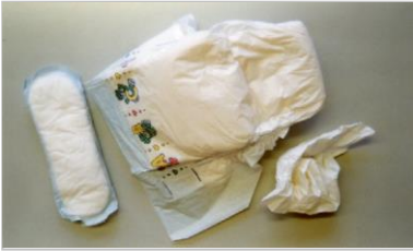
Çocuk bezleri ve diğer Hijyenik maddeler