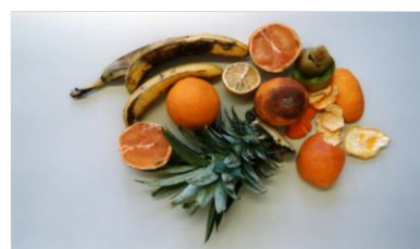
остатки цитрусовых фруктов