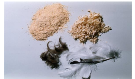
Holzspäne, Haare, Federn