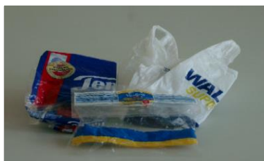
фольга, мешочки для покупок