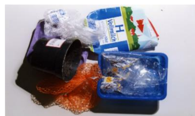
пластиковые мешочки, пакеты из-под напитков