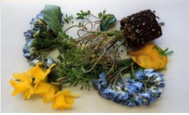
Bitki, Çiçek, Bahçe atıkları