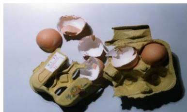
скорлупа от яиц