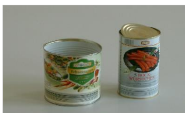
банки из-под консервов