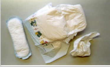
Bez ve diğer Hijyenik atıklar