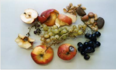
meyva artıkları, Cerez kabukları