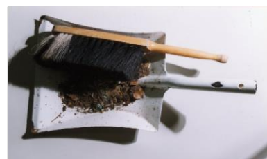
мусор от подметания