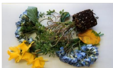
растения, цветы, отходы из огорода