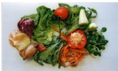
биологические отходы, отходы из огорода