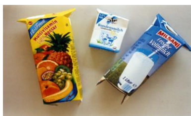
картонные упаковки из-под напитков