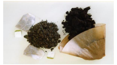
Kaffee-/teesatz (mit Filter)