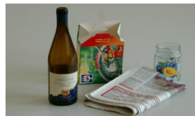
старое стекло, старая бумага, картон